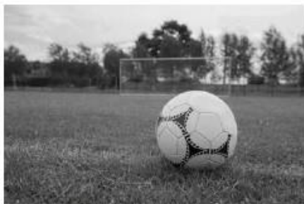
А – футбольное поле

10. Какой из изображённых на фотографиях объект может быть сооружён на участке, по которому проходит маршрут А–В (маршрут в задании 11)? Обоснуйте свой ответ.