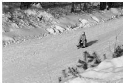
Б – санный спуск